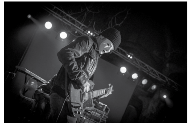
Fiesta Cinélantino : La Maldita Infamia