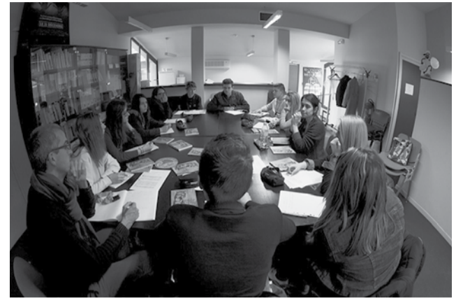
Jury lycéen de la compétition documentaire

Les conclusions de ces travaux seront rendues publiques le mercredi 16 mars à 16h30 à l'ESAV.