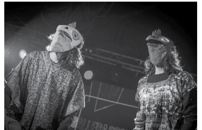
Fiesta Cinélantino : La Gallera Social Club